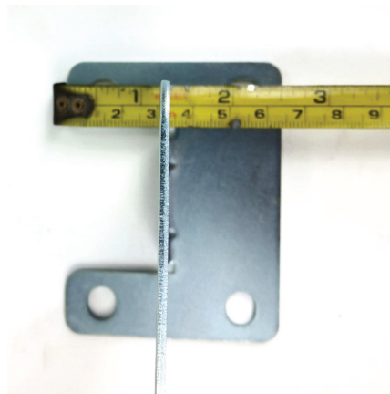
ตัวยึดกระจกกว้าง 6.3 \pm 0.2 cm.