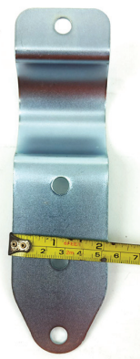
ตัวรัดเสา กว้าง 5.2 \pm 0.2 cm.