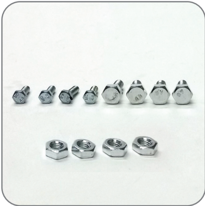
1. น็อต 6 เหลี่ยม