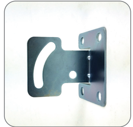
3. ตัวยึดกระจก