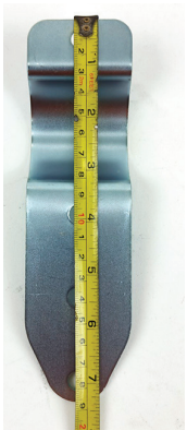
ตัวรัดเสา ยาว 8.6 \pm 0.2 cm.