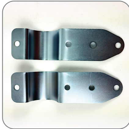
2. ตัวรัดเสา