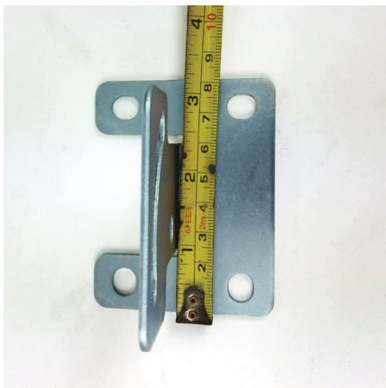
ตัวยึดกระจกยาว 8.1 \pm 0.2 cm.