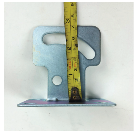
ตัวยึดกระจกสูง 7 \pm 0.2 cm.